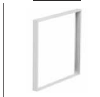
Marco de sujeción blanco